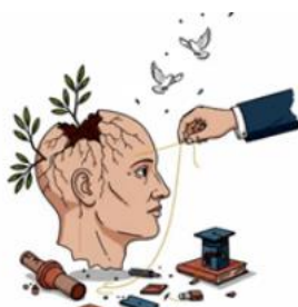
Figura. ALEGORÍA DEL REFERENCIAL ÉTICO FRENTE A LA CONTINGENCIA NACIONAL. La imagen ilustra la fragilidad del pensamiento institucional ante los procesos de fuerza. Representa el esfuerzo de la academia por restaurar la razón (hilo de oro) y la vida (olivo) sobre las ruinas de la desestacionalización, reafirmando el compromiso de la investigación con la reconstrucción del tejido institucional y social a través de la concordia y el rigor ético.

A propósito de la Sesión del Consejo de Facultad, 13/01/2026, primera del nuevo año, caracterizada principalmente por la discusión del punto único “ Situación de Estado de Conmoción Exterior en Venezuela ”, desde esta Coordinación se informa sobre el compromiso de la Investigación con la “Reconstrucción del Tejido Institucional y Social”. Se reflexionaba en esa ocasión sobre el Lenguaje como Arquitecto de la Actitud para Transformar la Violencia en Dialogo (Objetivo prioritario del Protocolo de Activación en caso de Violencia y Discriminación en la UCV).